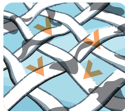
Multipolymerový systém chrání různé typy tkanin před opětovným usazováním nečistot během praní. Díky technologii multi-bělosti je bílá barva bělejší při různých teplotách praní a zabraňuje žloutnutí bílé barvy po více praních.